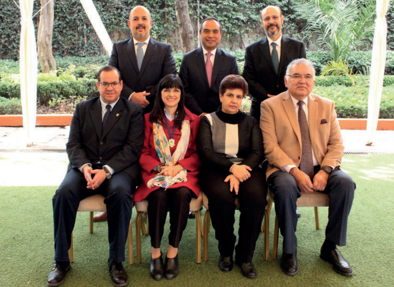
MESA DIRECTIVA 2020 DE LA ASOCIACIÓN MEXICANA DE GASTROENTEROLOGÍA.

enfermedades crónicas, debido a que el país registra un índice muy alto de casos por hígado graso no alcohólico y cifras elevadas respecto a defunciones por cirrosis, diabetes, hipertensión y diversas patologías asociadas al sobrepeso.