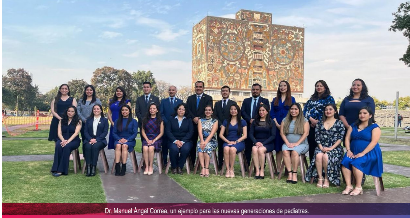
Dr. Manuel Ángel Correa, un ejemplo para las nuevas generaciones de pediatras.