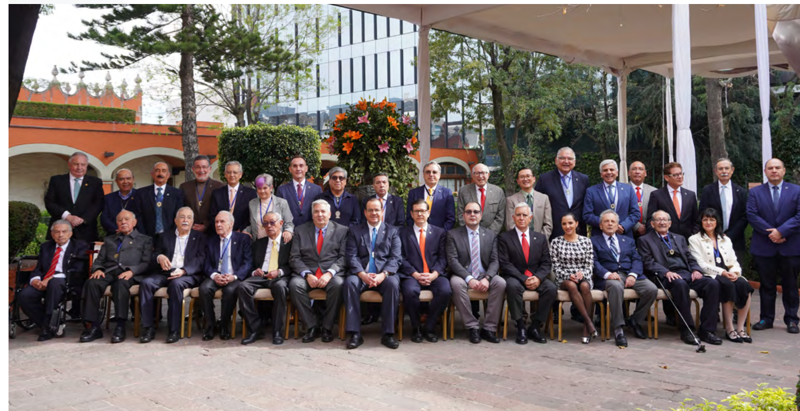
Fotografía grupal de Expresidentes de la Asociación Mexicana de Gastroenterología.

diferentes categorías de socios y la AMG ofrece a los residentes la categoría de asociados en entrenamiento, para ir conociendo a la Asociación y asistir a todos los eventos a un costo menor durante su proceso de entrenamiento y poder eventualmente cambiar a la categoría de Socio Activo. Tras quince años se pasa a la categoría de Socio Titular y después a Socio Emérito. Tenemos una categoría especial para Miembros Honorarios, que son gastroenterólogos extranjeros que han colaborado de manera importante”.